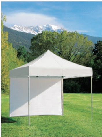
Perete lateral standard