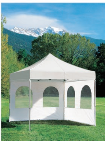
Perete lateral cu ferestre