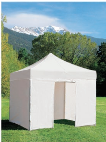
Perete lateral cu uşă